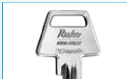
Gammel nøgle med trapez-formet hoved uden patent