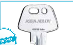
Ny, patenteret nøgle